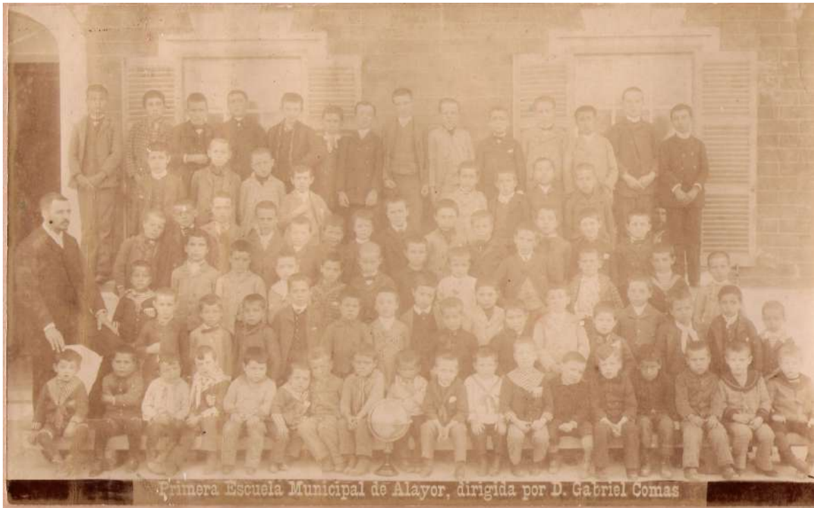
Foto escola Gabriel Comas: a la foto podem veure el mestre amb gairebé vuitanta fillets de totes les edats. És fàcil imaginar que la gestió adequada de tots aquests fillets, amb coneixements ben diferents no era una tasca gens fàcil sinó es recorria a la graduació per nivells. La demanda de la graduació escolar, per tant, és reivindicació lògica, tot i que la preocupació social per l'educació era cosa d'un col·lectiu molt reduït.

L'escola graduada implica la racionalització i aplicació del principi de divisió del treball i l'establiment de criteris d'administració científica, per tant, la implantació d'una organització escolar d'acord amb els principis de la pedagogia científica. Però eren molts els defensors de la clàssica escola unitària, amb un sol mestre per a tots els alumnes; per tant la implantació de les escoles graduades arreu de l'estat no va ser una tasca fàcil. Sorpren força que aquesta història que narrem succeís en un petit municipi de l'illa de Menorca, allunyat dels centres de poder i de decisió i que fos en aquest indret on es consolidés un ampli moviment social de suport a l'escola pública.