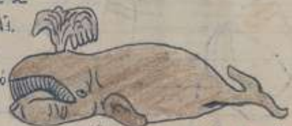
Ballena largo 30 ó 16 metros.

Según dicen los libros de que las ballenas se extraen para fabricar de ellas aceite que dicho aceite se emplea para mover las máquinas alambrotas. de una ballena se puede hacer 30 barriles en Magón cuando llegó el barco Frances llevó 2 barriles que creo separados en partes los repartieron por los quebles que tocora muy poca cosa en las fondeas la Punta Central de Alvarado de Aménica creo pero yo que tendría bastante para ella las máquinas de coser emplean dicho aceite.