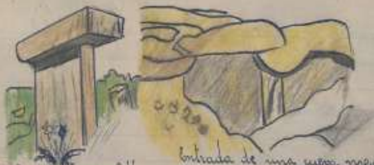
Taula de Borrauba