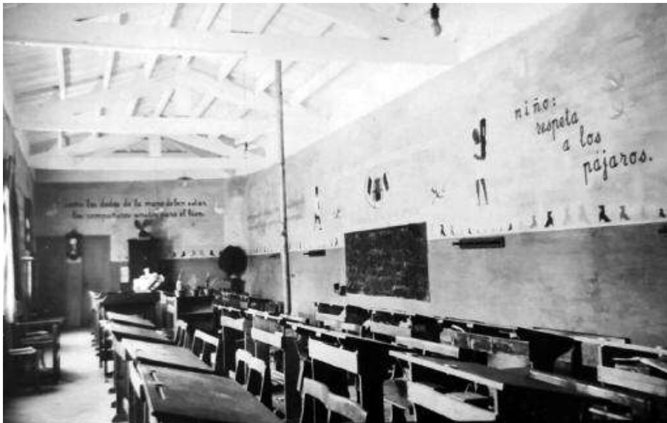
Interior de l'Escola de Ferreries (1935)

paraules d'Arquimedes quan demanava un punt de recolzament per aixecar el món. Ells tenen el punt de recolzament: s'anomena infant. Que els modelin i serà l'home del demà que recordarà en tots els moments el seu Mestre com jo recordo els meus en especial a la que va ser per a la meua Mestra i la Mare.