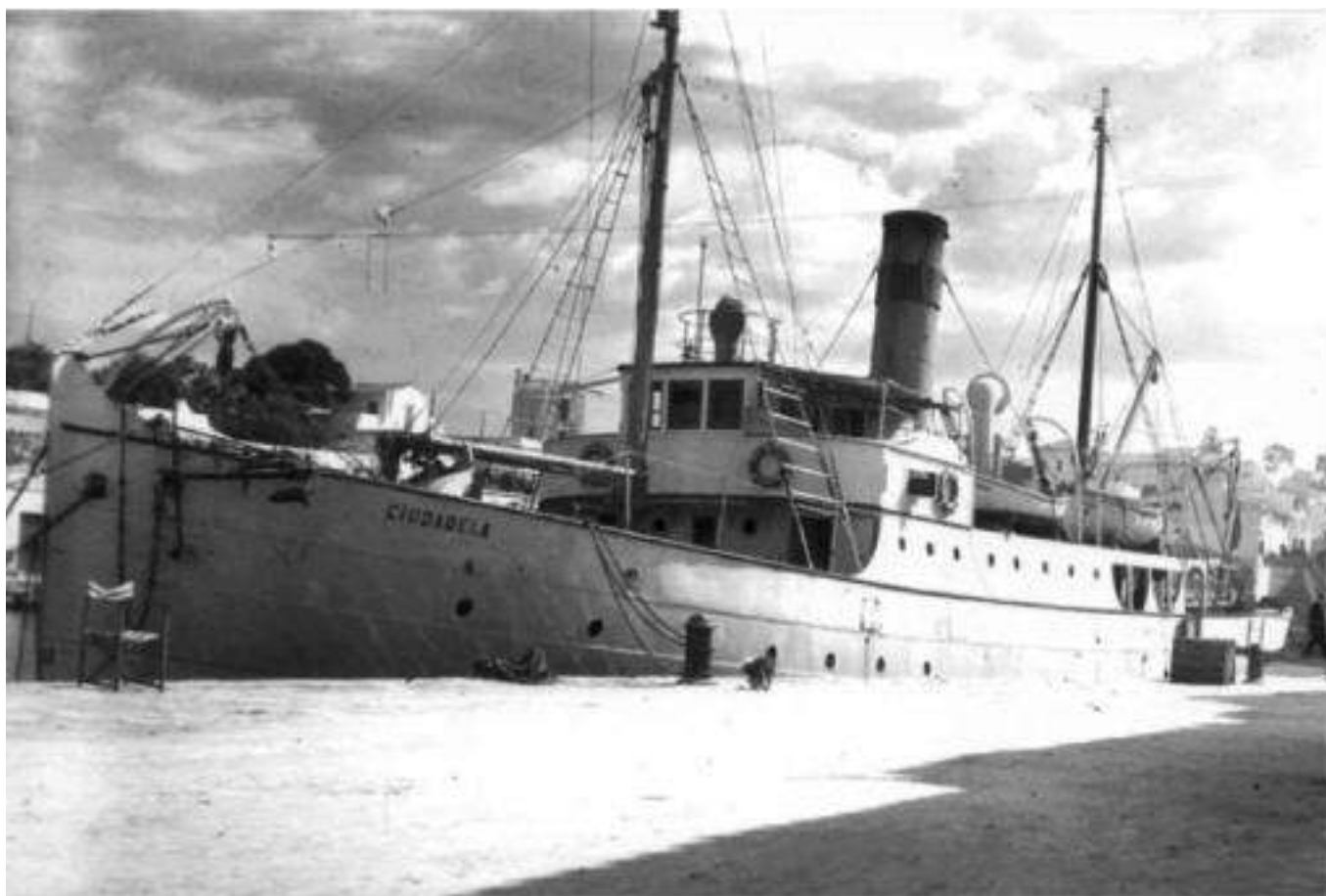
Vaixell de vapor Ciudadela. 1936.

sones (entre el 21 de novembre de 1936 i el 27 de gener de 1941), de les quals 4 moriren per enfermetats i 51 les executaren. Precisament seria un altre menorquí, Avel·lí Sotes López el darrer afusellat allà, el 27 de gener de 1941.