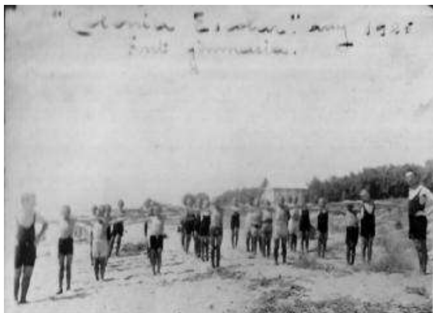
Fotografies de Jaume Farré Vidal de l'any 1925 en unes colònies d'estiu.