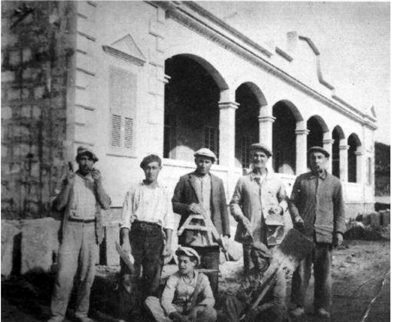
Escuelas Nacionales, 1933.

ders, tot i que a Menorca no aconseguí mai prou recursos per tenir-ne una d'impremta. El mètode Freinet, que agafà el nom de l'il·lustre pedagog marxista Célestin Freinet, proposava que l'educació estigués sempre vinculada al context i a la realitat per tal de respondre a les necessitats i les inquietuds dels joves educants.