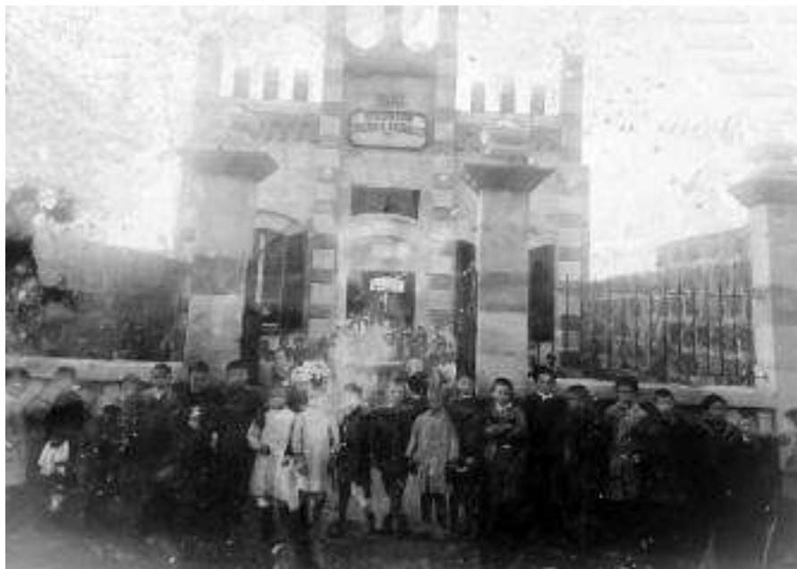
Alumnes formats a l'entrada de l'Escola Racionalista de Ciutadella

xement racional, no dogmàtic. Tan és així que alguns autors van situar a Benejam dins el corrent de l'escola racionalista, quan açò és cronològicament impossible. És cert emperò que Joan Benejam és en certa manera, al marge del component religiós, un avançat en el moviment que sorgiria de l'Escola Racional de Ferrer i Guàrdia. Recordem que Benejam, entre d'altres, va publicar la revista educativa La enseñanza racional (1888-1889) i La escuela práctica (1894-1895), títols -i contingut- que fàcilment podrien ser considerats d'inspiració racionalista.