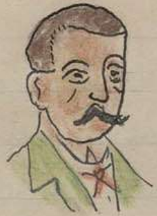
M. GABRIEL Y GALÁN

La vida era solemne, puro y sereno el pensamiento era, sosegado el sentir, como las brisas, mudo y fuerte el amor, mansas las penas, austeros los placeres, raigadas las creencias, sabroso el pan, reparador el sueño, fácil el bien, y pura la conciencia